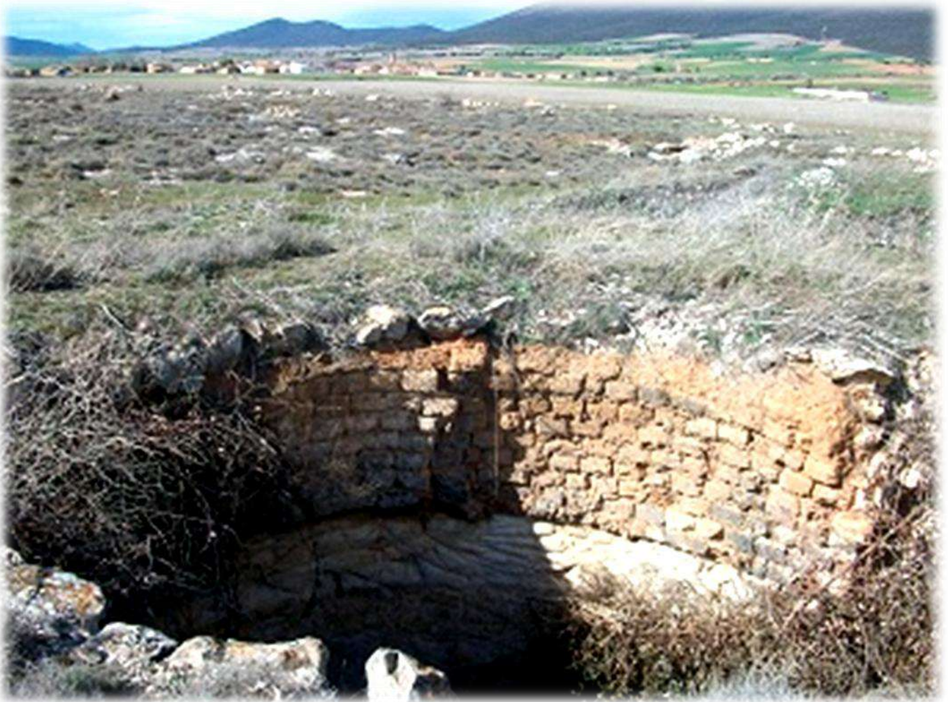
“Una de las caleras, con el pueblo y la sierra al fondo” Marcos Sierra