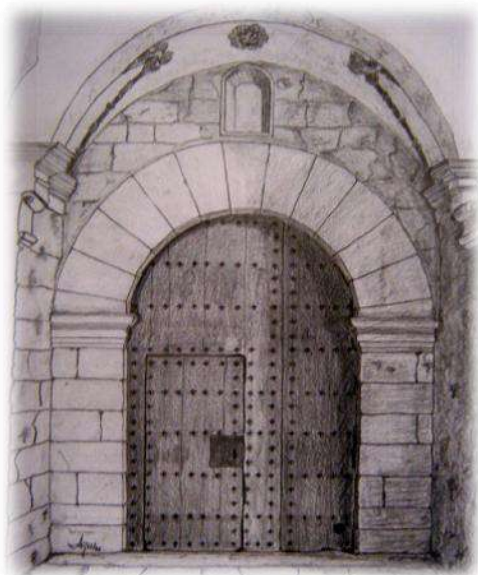
Dibujo de Agustín Cerro